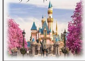
東京ディズニーリゾート

1983年、日本でオープンした「東京ディズニーランド」は、冒険や童話、未来などをテーマに、7つのテーマランドから構成されています。ディズニー映画の世界を実際に体験できるように立体化されたパークでは、ゲストはアトラクションやエンターテイメントなどの体験を通して、ディズニーマジックによる非日常的な世界をお楽しみいただけます。