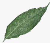
マンダリン オリエンタル 東京